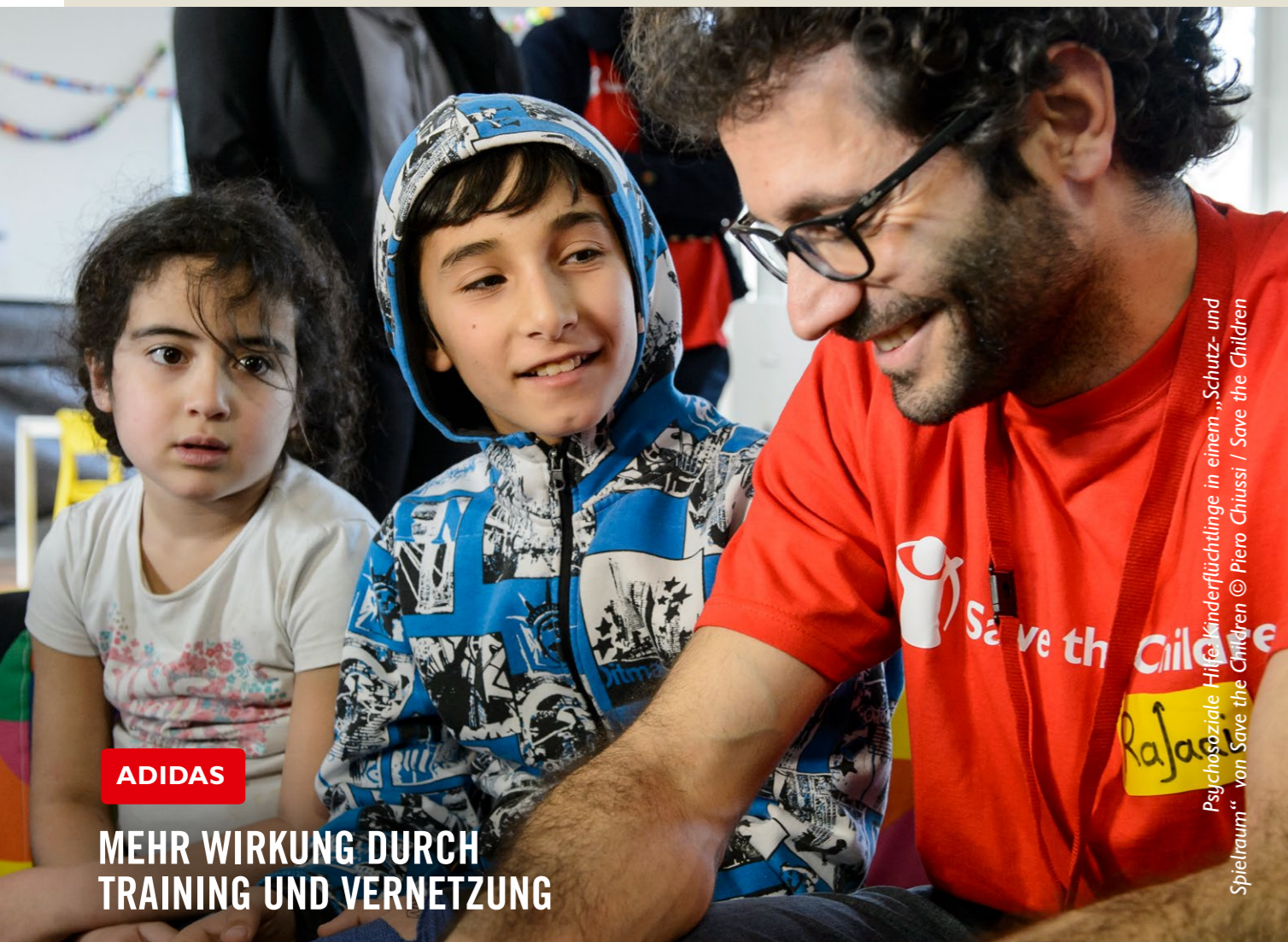
Psychosoziale Hilfe für Kinderflüchtlinge in einem „Schutz- und Spielraum“ von Save the Children