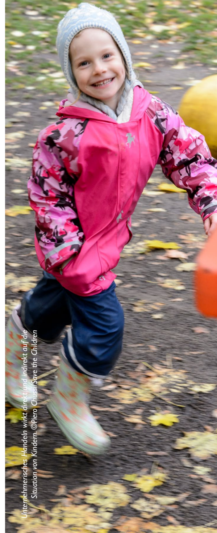
Unternehmerisches Handeln wirkt direkt und indirekt auf die Situation von Kindern.