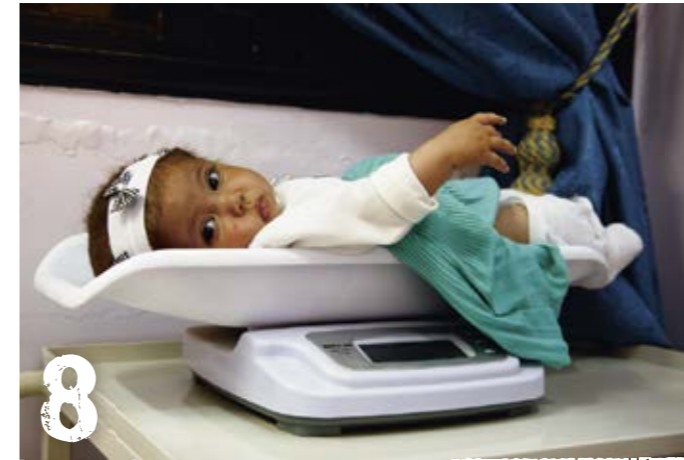
Medizinische Hilfe für Kinder in Nordsyrien