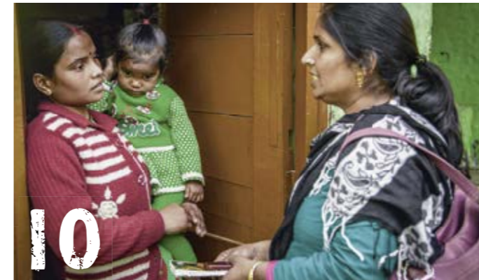
In den Slums von Delhi bildet Save the Children Gesundheitshelferinnen aus.