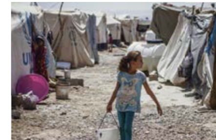
Die Erfahrungen auf der Flucht sind für Kinder oft belastend.

Aufgrund ihrer Erlebnisse sind viele Kinder verängstigt, manche reagieren aggressiv oder haben nachts Alpträume. Die elfjährige Rahaf* zum Beispiel sprach nach ihrer Ankunft im irakischen Flüchtlingslager kaum ein Wort. Über viele Tage hatte sie in ihrer Heimatstadt schwere Gefechte erlebt. „Wir flohen in eine nahegelegte Moschee, aber der Be-