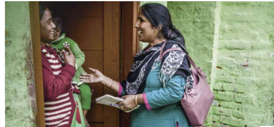
In 60 Slums rund um Delhi hat Save the Children Gesundheitshelferinnen ausgebildet. Sie klären Frauen über Gesundheit und Hygiene auf und informieren über Vorsorgemöglichkeiten.