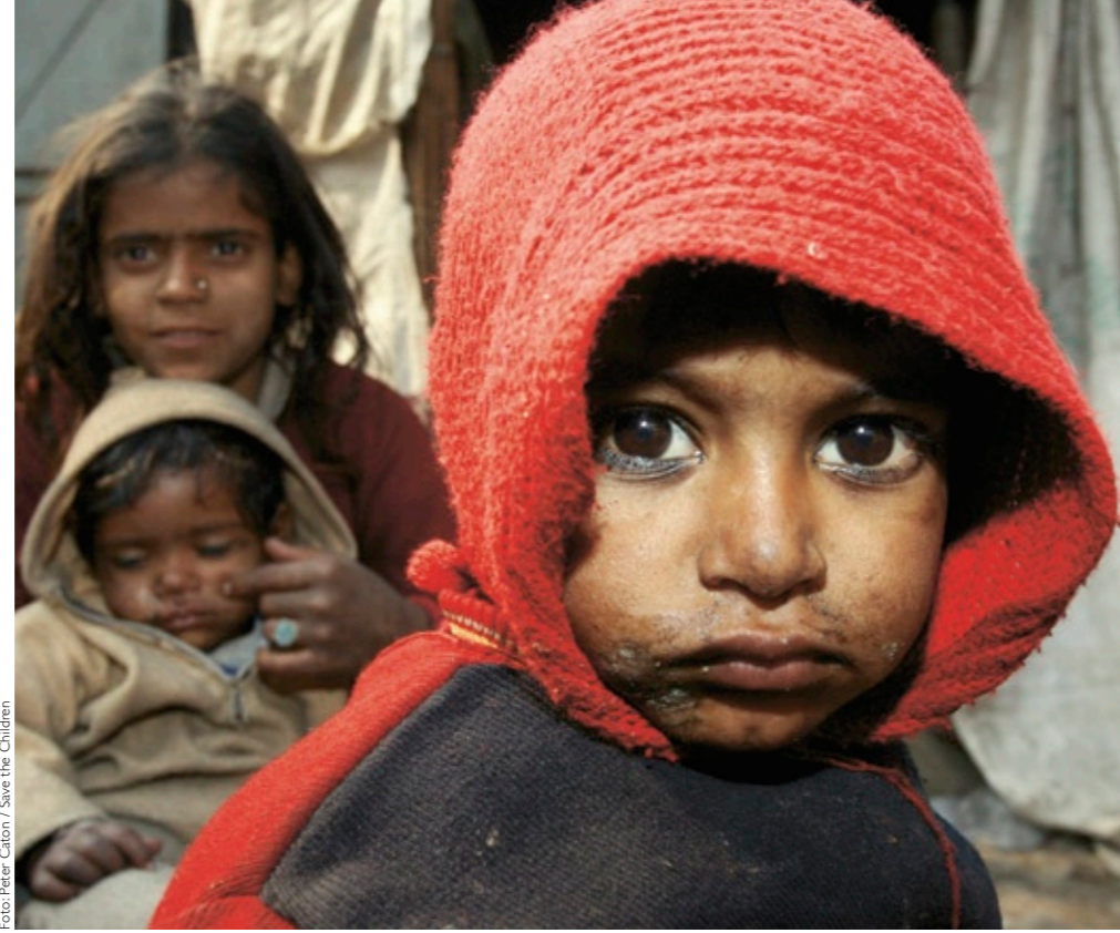
Slumkinder im Elendsviertel von Bhagwanpura, Indien. Mehr als 25 000 Menschen leben hier buchstäblich auf der Straße.