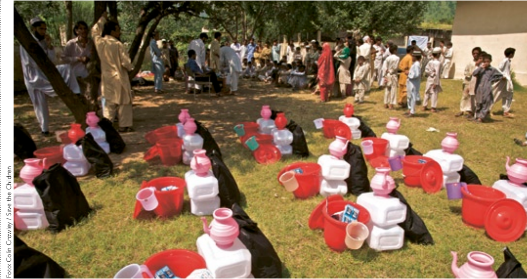
Save the Children verteilt im Swat-Tal von Pakistan Hygiene-Sets, um die Ausbreitung von Krankheiten zu vermeiden.

Ein Junge zeichnet eine Karte von seinem Dorf Zee Phyu im Irrawaddy-Delta in Myanmar. Save the Children hilft Kindern und ihren Familien, gefährliche Situationen einschätzen zu lernen und im Fall eines erneuten Zyklons sichere Orte zu bestimmen. Zwei Drittel der Kinder des Dorfes haben ihr Leben verloren, als der Zyklon Nargis im Mai 2008 die Region verwüstete.