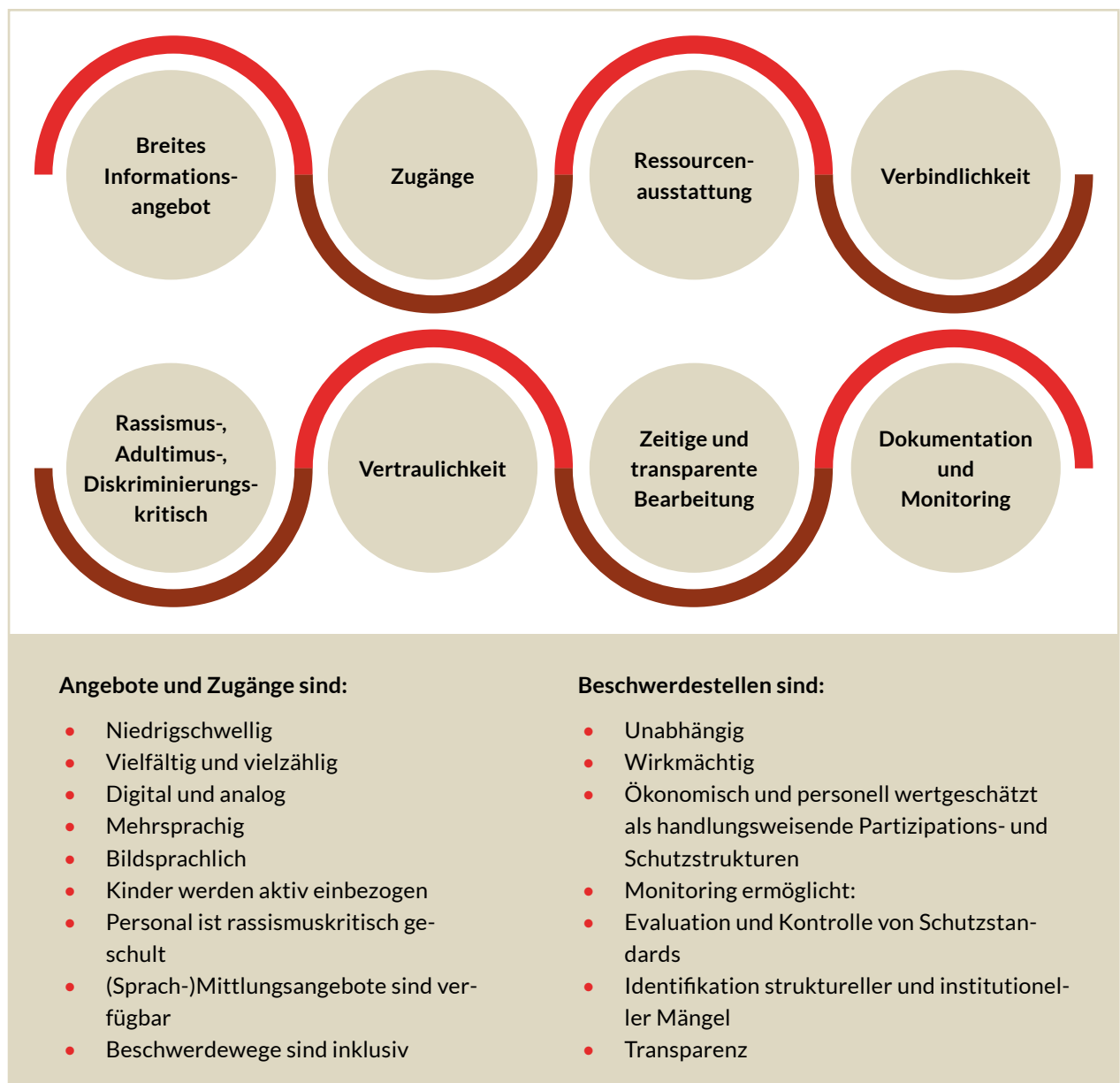
Abbildung 1 Kindgerechte Beschwerdeverfahren

Umfeld sicherzustellen. Dabei sollten alle Kinder als eigenständige Persönlichkeiten und Träger*innen eigener Rechte wahrgenommen werden, die aktiv an den sie betreffenden Maßnahmen teilhaben können. Die Etablierung und Umsetzung kindergerechter Beschwerdeverfahren muss sich entlang vielfältiger ineinandergreifender Gütekriterien orientieren (siehe Abbildung 1): Nur so kann die Wirksamkeit dieser Verfahren als wesentlicher Bestandteil von Teilhabe- und Schutzkonzepten für alle Kinder und Jugendlichen sichergestellt werden.