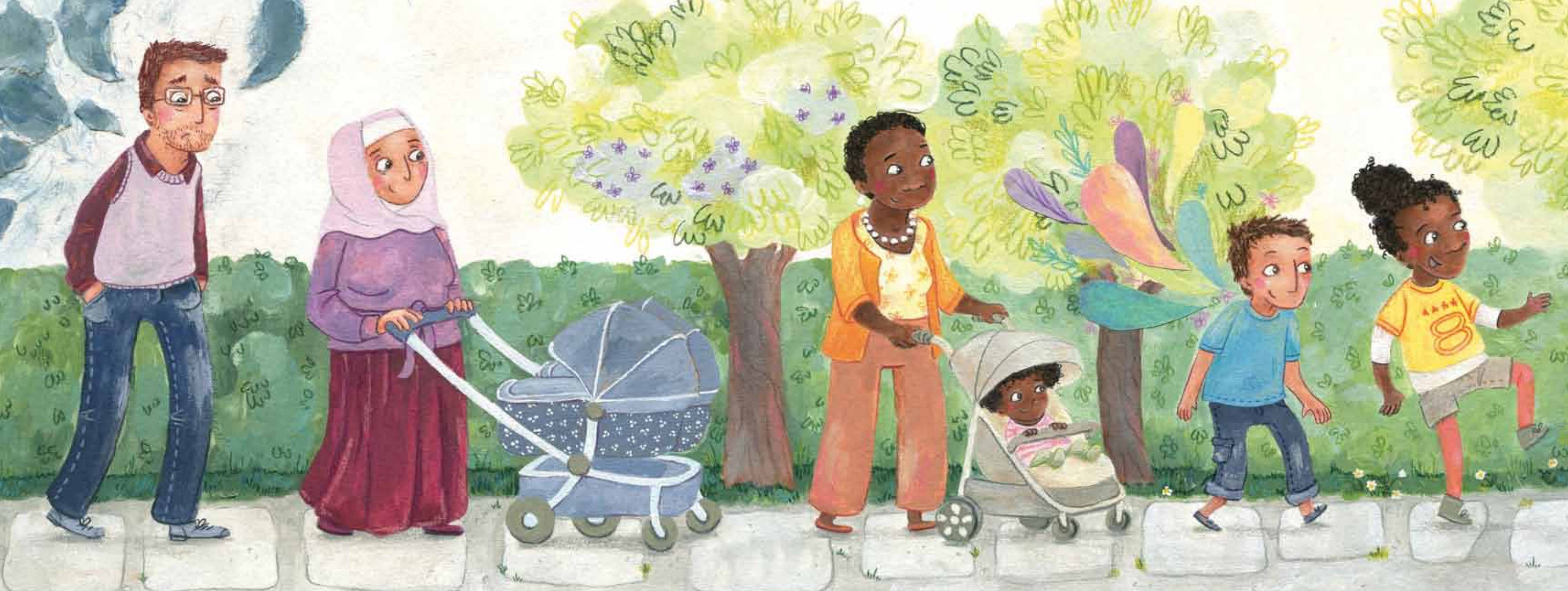
Markaasay dhammaantood u ambabaxeen xarunta qoyska.